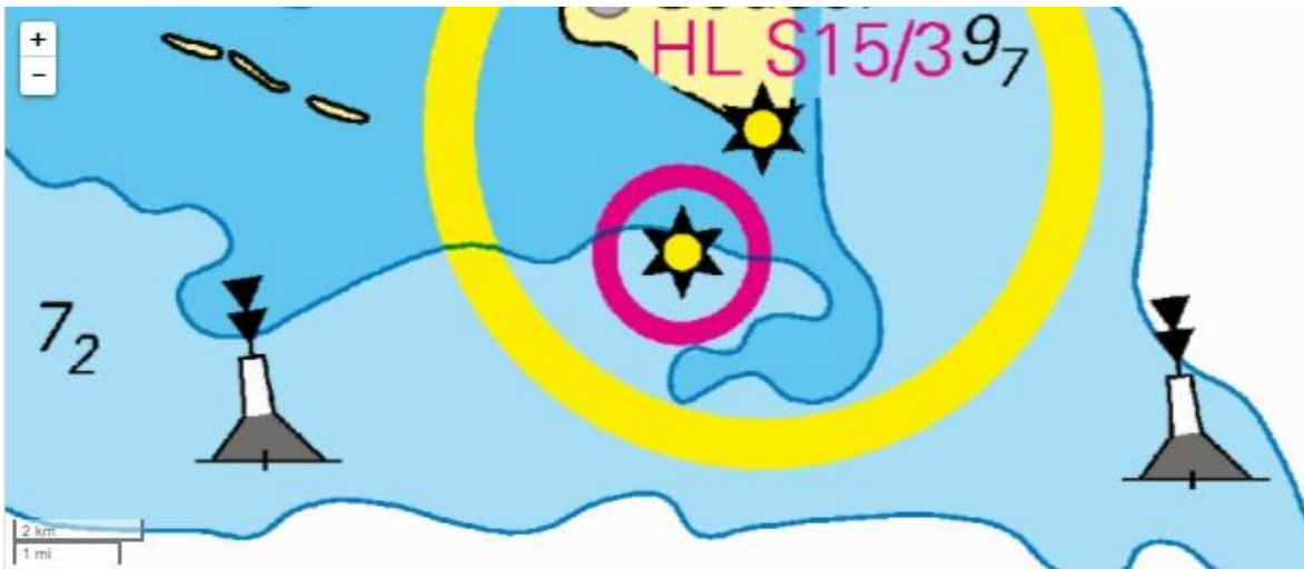
Figur 2. Søkort for Gedser Odde.

Det sydgående landtræk kan komme over en bred front mod observationspladsen. Det nordgående går mere målrettet fra havet ind mod oddespidsen.