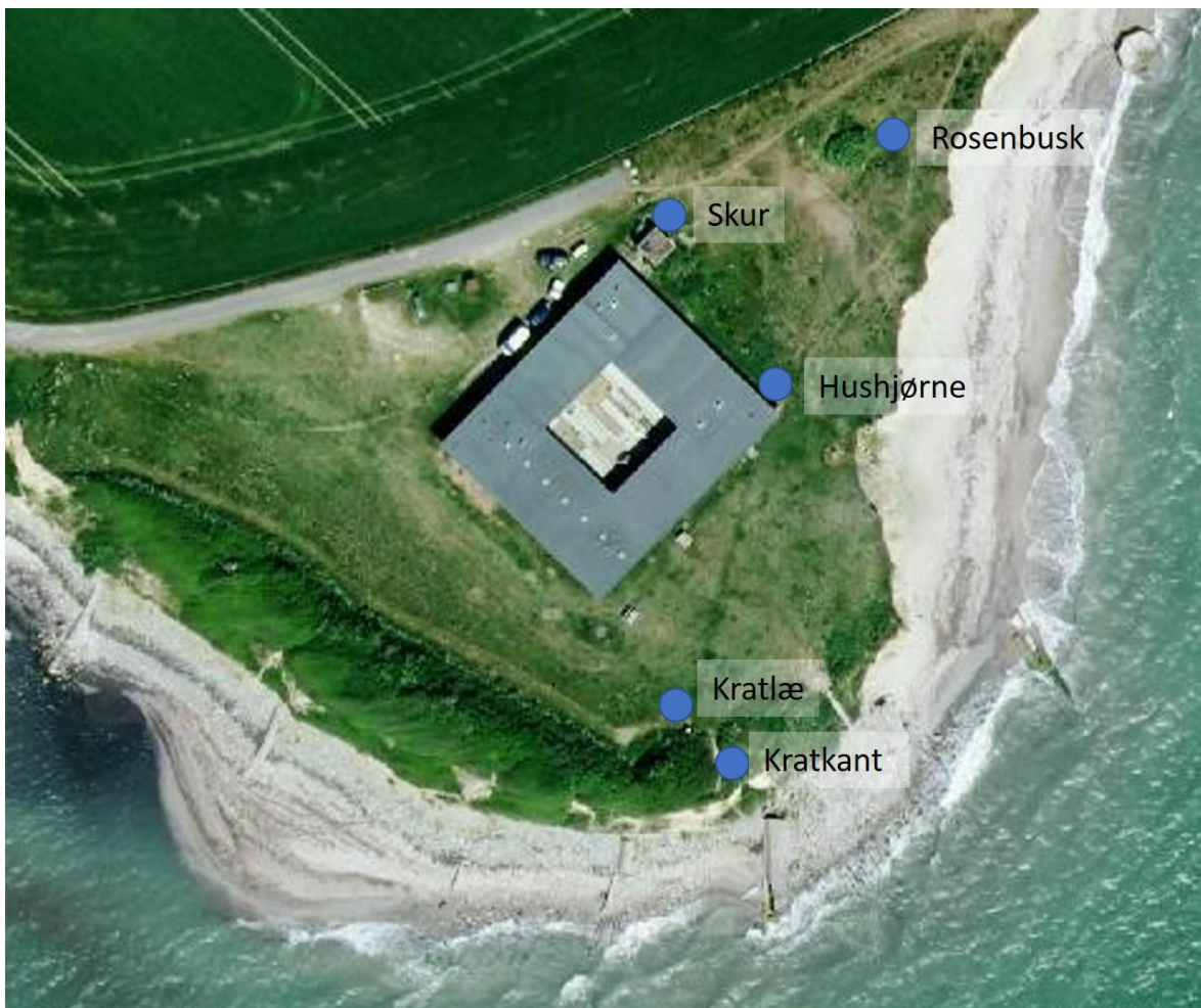
Figur 1. Nogle af observationspunkterne.

Alt efter vind, vejr og fugletræk må man vælge den bedste placering.